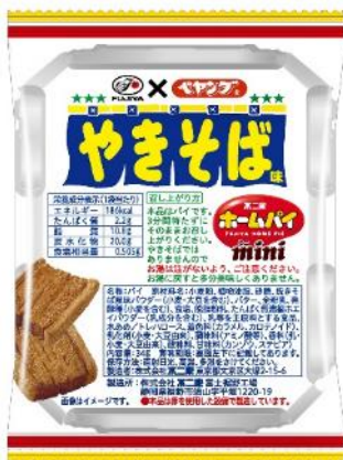
※CVS・交通ルート限定