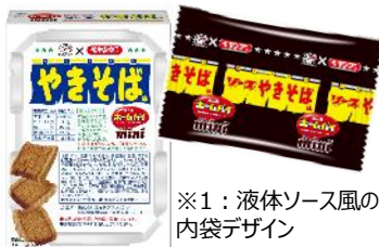
※1：液体ソース風の内袋デザイン

「おいしさ」と「楽しさ」の発見をしていただきたいと思います。それぞれの商品をすでにご存じのお客様には、コラボすることでその「おいしさ」と「楽しさ」の再発見を、商品を知らないお客様には新たな「おいしさ」と「楽しさ」を知っていただきたいと思います。