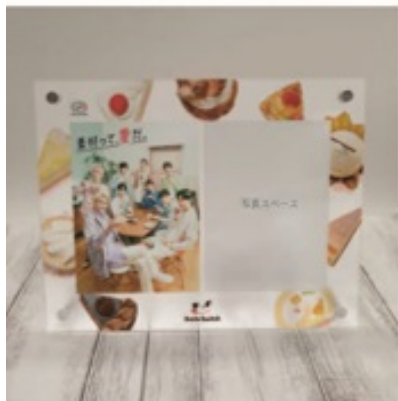
▲オリジナルフォトフレーム 本体 230×180mm 透明アクリル部分 3mm+3mm