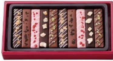
「スティックチョコアソート」 1月下旬発売、税込 1,200 円