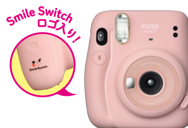
▲Smile Switch オリジナルチェキ 幅 107.6×奥行 67.3×高さ 121.2mm 写真画面サイズ 62×46mm

詳しい応募方法などキャンペーンの詳細については、キャンペーンサイトをご覧ください。