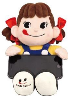
▲ペコちゃんぬいぐるみ スマホスタンド 全長約 290mm (座った状態：約 200mm)