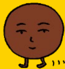
▲キャラクターの「まみれさん」(救世主)

現代社会において、人々はいろいろな悩みを抱えている。仕事、子育て、人間関係、お金、勉強、新生活様式などなど……たくさん。ストレス解消に好きなものを食べたいよ……と思うけども、健康意識・志向が高まり、嗜好品のお菓子に対して罪悪感が生まれている。でも本音は、「カロリーが高いから」とか「糖質は悪」とかどーでもいいのよ。あまーいものを無限に食べたいという人類の心の叫びが形となり現れた救世主。