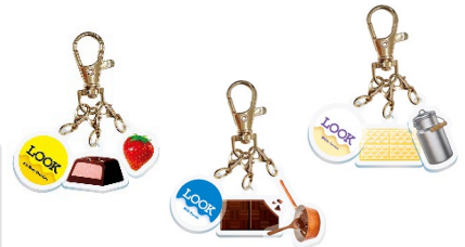
全 10 種からランダム

※「ルック(ア・ラ・モード)」「ルック(ミルクパレード)」「ルック(ホワイトラバース)」のそれぞれのフレーバーとの組み合わせで全10種