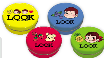
缶 4 種類がセットに！

「ルック (ア・ラ・モード)」の各フレーバーカラーをイメージした小さな缶に、ルックを合計8粒詰めました。食べ終わったら小物入れにするのにぴったりなデザインとサイズ感です。