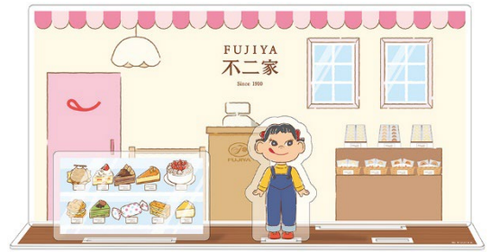
組み立てイメージ