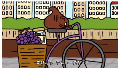
舞げよう ラムレーズン～