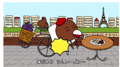
探訪しよう ラムレーズン～